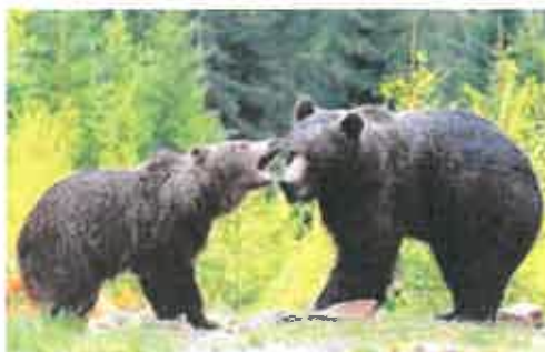
S Václavem Vašíčkem na výpravě za medvědy