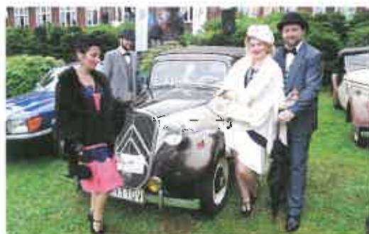
Do Jeseníků přijely historické vozy