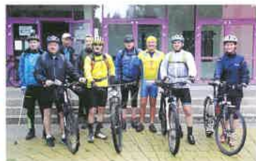
Účast Rýmařovské padesátky poznamenalo nevlídné počasí