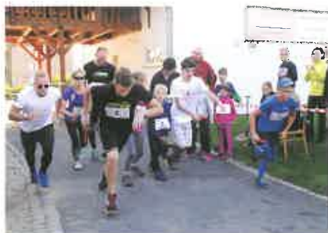
Štafety běžely třikrát 30 km za demokracii