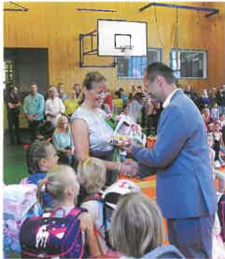
Letošní prvňáci nastoupili do čtyř prvních tříd