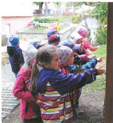
Zahrada mateřské školy na ulici 1. máje byla slavnostně otevřena