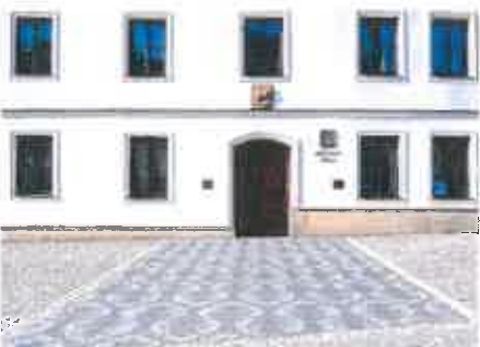
Návrhy na oživení veřejného prostoru Rýmařova dostávají reálnou podobu