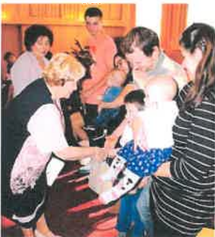
Město zapsalo do svazku obce dvanáct nových občánků