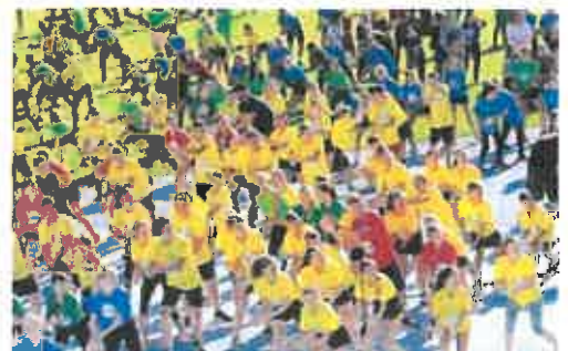
Žáci a učitelé se v Brně zúčastnili republikového finále OVOV