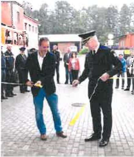
Nová hasičská zbrojnice zahájila provoz